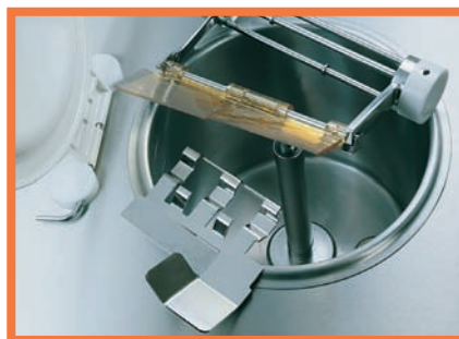
Agitatore speciale con supporto smontabile ad alta turbolenza - Special high turbulence beater with removable support - Agitateur spécial à turbulence avec support démontable - Das besondere Rührwerk mit abnehmbaren Flügel, für hohe Turbulenz - Agitador aspecial de alta turbolenza con soporte desmontabile.

Elektronik Tastatur mit doppeltem Display Alarm- und Ausfallmanagement Ereignishistorie