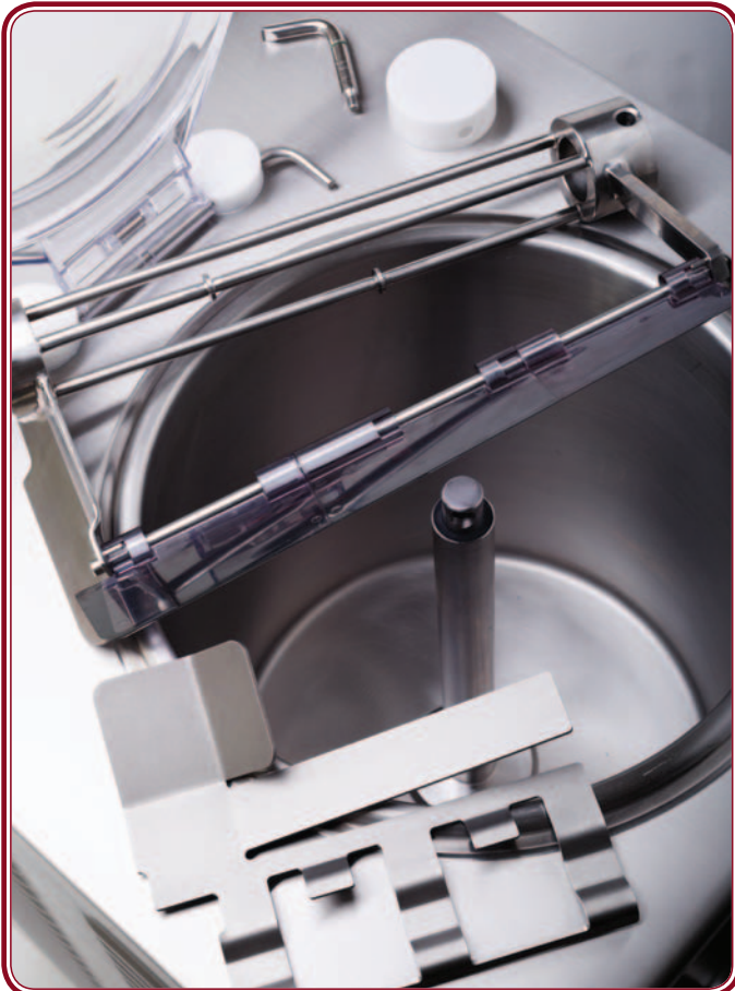
Agitatore con supporto smontabile Special beater with removable support