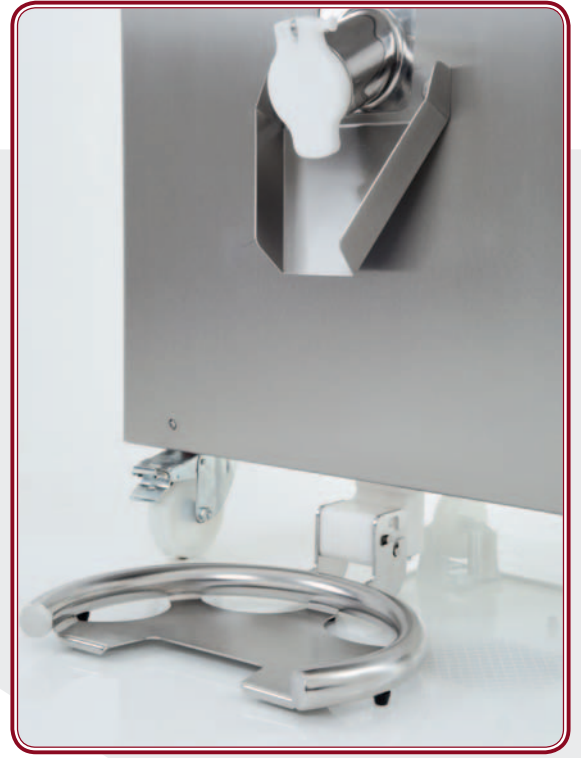
Rubinetto d'estrazione con comando elettronico Electrically controlled outlet tap